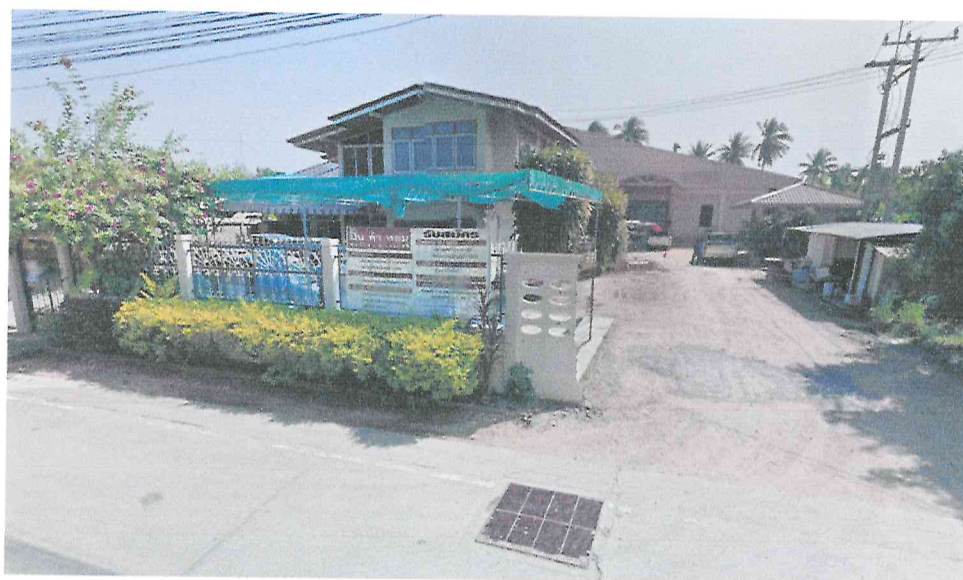
บริษัท วี อาร์ ฟู้ด แอนด์ โปรดัก จำกัด (บ้านคำหอม)