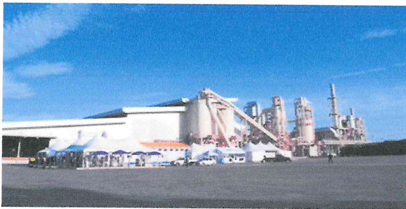
4. โรงงาน เมโทร เอ็ม ดี เอฟ จำกัด หมู่ที่ 5 ตำบลห้วยเหนียว