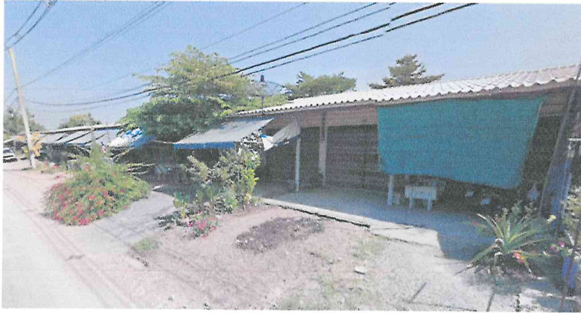
1. ห้องแถวเชิงสะพาน หมู่ที่ 1 ตำบลหวายเหนียว