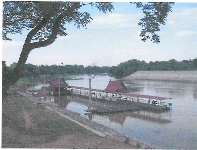
3. แพลตฟอร์มวัดห้วยเหนียว หมู่ที่ 4 ตำบลห้วยเหนียว