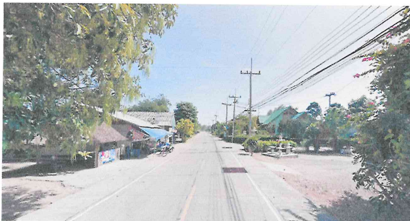
5. ชุมชนริมบ้านวังทอง หมู่ที่ 7 ตำบลห้วยเหนียว