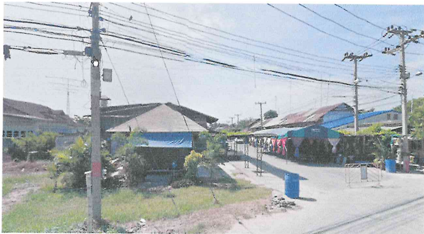
2. ชุมชนบ้านหวายเหนียว หมู่ที่ 4 ตำบลหวายเหนียว